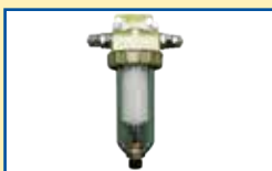
Feinstaubfilter mit Filterhülse