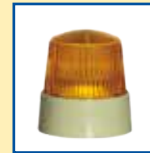
Blitzpulser (auch als EX-Version erhältlich)