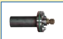
Montagestutzen mit Einfachflansch