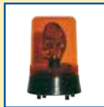
Drehspiegelleuchte (auch als EX-Version erhältlich)